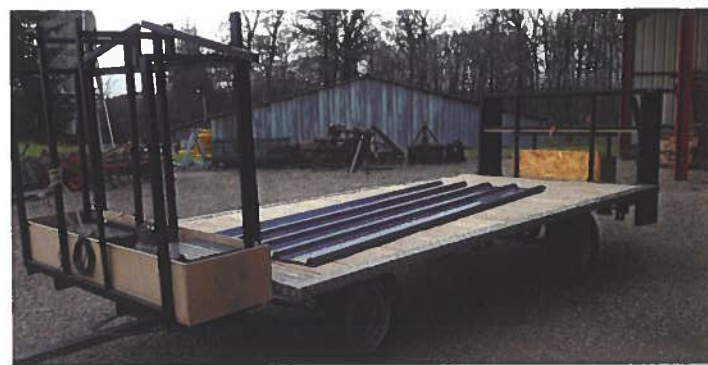
Ce char va servir pour le transport des estrades.